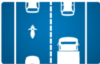
DIE RETTUNGSGASSE AUF ZWEI SPUREN

Fahrzeuglenker werden verpflichtet bei Stocken des Verkehrs eine Gasse zu bilden, um Einsatzfahrzeugen die Durchfahrt zu ermöglichen.