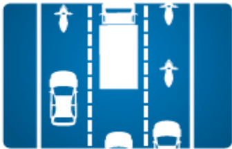
DIE RETTUNGSGASSE AUF MEHREREN SPUREN